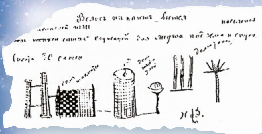
Архитектурные рисунки Велимира Хлебникова

нять язык можно в контексте вибрационно-волновой картины Вселенной. «По-видимому, язык так же мудр, как природа, и мы только с ростом науки учимся читать его... Мудростью языка давно уже вскрыта световая природа мира... Сквозь нравы сквозит огонь» 18 .