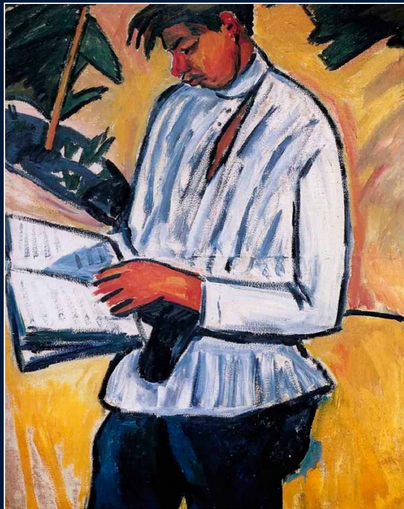
М.Ф. Ларионов. Портрет поэта Велимира Хлебникова. 1910

Космизм – это отрицание пустоты Вселенной, это убеждение, что она населена разнообразными формами жизни и разума, и признание возможно-