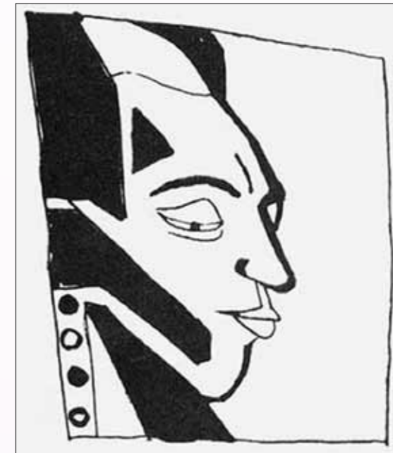
В. Бурлюк. Портрет Велимира Хлебникова. 1913