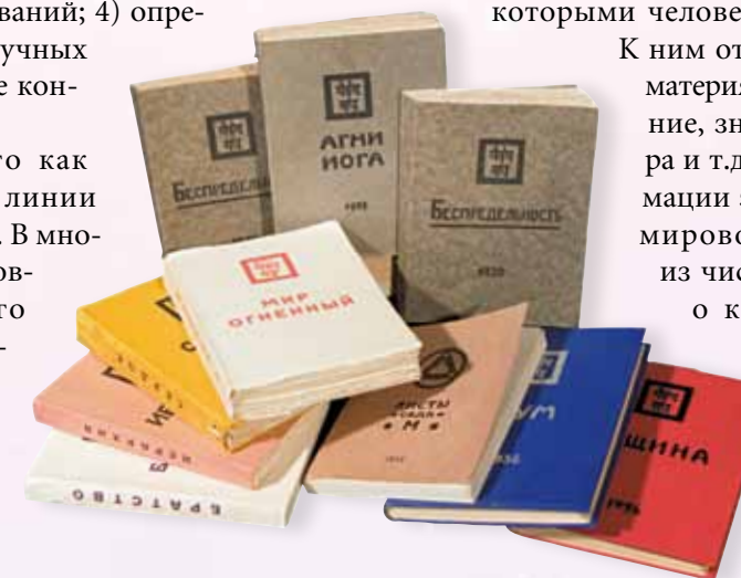
Первые издания книг Живой Этики

способности к синтезу знаний и формирование на этой основе целостной научной картины мира. Синтез – это способность ученого объединять многообразие явлений Мироздания и осознавать их как единое целое, где высшее ведет за собой низшее. Чем выше степень синтеза, присущая мышлению данного человека, тем более широкими являются горизонты знаний, границы которых он способен обозреть и осмыслить. Развитие способности к синтезу и расширение сознания ученого, как правило, обусловлены активностью его творческой деятельности, накоплением знаний в области науки, философии, искусства и интеграцией этих знаний, наконец, духовным опытом человека и т.д. Важное значение для проявления синтеза как внутреннего качества ученого имеет уровень его культуры, которая, будучи самоорганизующейся системой духа, открывает перед ним благодаря его творческой деятельности все больше возможностей и превращает человека из объекта в субъект Космической эволюции.