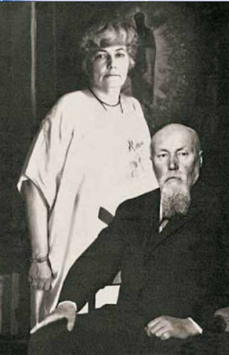
Е.И. Рерих и Н.К. Рерих

обликами обуславливает рост сознания человека, а значит, дает возможность этому человеку эволюционировать. Высокая энергетика героических деяний принимает активное участие в совершенствовании материи плотного мира. В книге «Надземное» есть такой образ: «Что же представляют собою герои и мученики? В смысле энергетическом, они составляют как бы живые вулканы, извергающие напряженные энергии. Действительно, такие напряжения необходимы для эволюции» 43 .