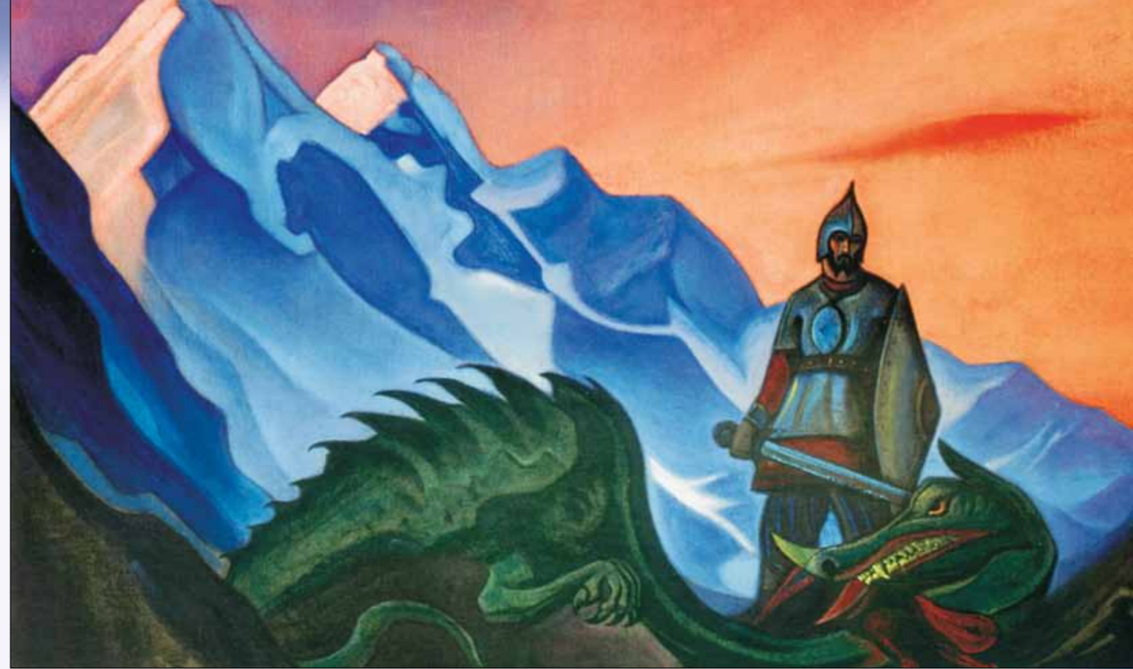
Н.К. Рерих. Победа. 1942

Космическая эволюция в Живой Этике тесно связана с одухотворенным Космосом, и в первую очередь с таким сложным и величественным понятием, как Космический Магнит , в орбите которо-