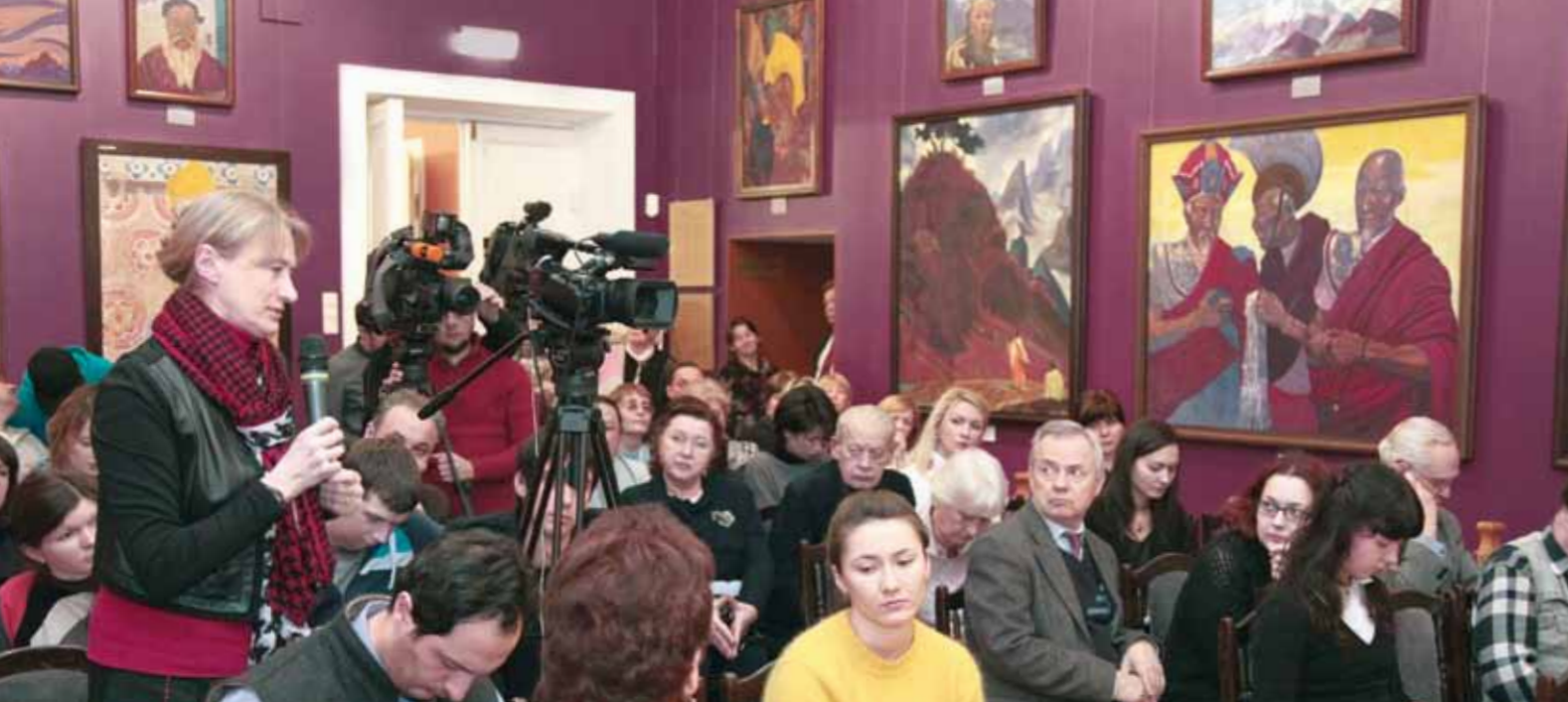
Рабочий момент пресс-конференции

без учета культурной деятельности и проектов. В пределах 150 миллионов в год – это только на то, чтобы музей работал. С.Н. Рерих в своей концепции деятельности музея четко поставил задачу: музей – это живой организм, который должен вести масштабную культурную работу. Беда будет, если нам придется закрыть многие культурные проекты. Они действуют не только в России, но и за рубежом. Мы представляем престижные международные организации: «Голубой щит», Красный Крест, ИКОМ, Всеевропейскую федерацию по культурному наследию «Европа Ностра», являемся активным членом Департамента общественной информации ООН и т. д. Для поддержания этих связей требуются средства, все это делал наш меценат. Опыт, повторяю, показывает, что Культуру, в частности такой музей, как наш, нельзя сохранить на общественные средства. Тут и нужны меценаты, люди бизнеса. Экономика не только для производства, она поддерживает Культуру, которая питает экономику, – это процесс взаимосвязанный. Если этого не будет, Культура не сможет развиваться.