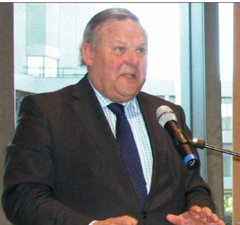
Стивен ван Хоохстратен

Эндрю Карнеги. Внутреннее убранство составляют деревянные скульптуры, витражи, мозаика, гобелены и предметы искусства, полученные в дар от государств, которые участвовали в двух Гаагских конференциях мира. Они многообразны, из разных времен и стилевых жанров, но чувства эклектики не создается. Напротив, они, отражая разнообразие мировых культур, оттеняют и дополняют друг друга. Теперь кроме Постоянной палаты Третейского суда здесь находится Международный суд ООН.