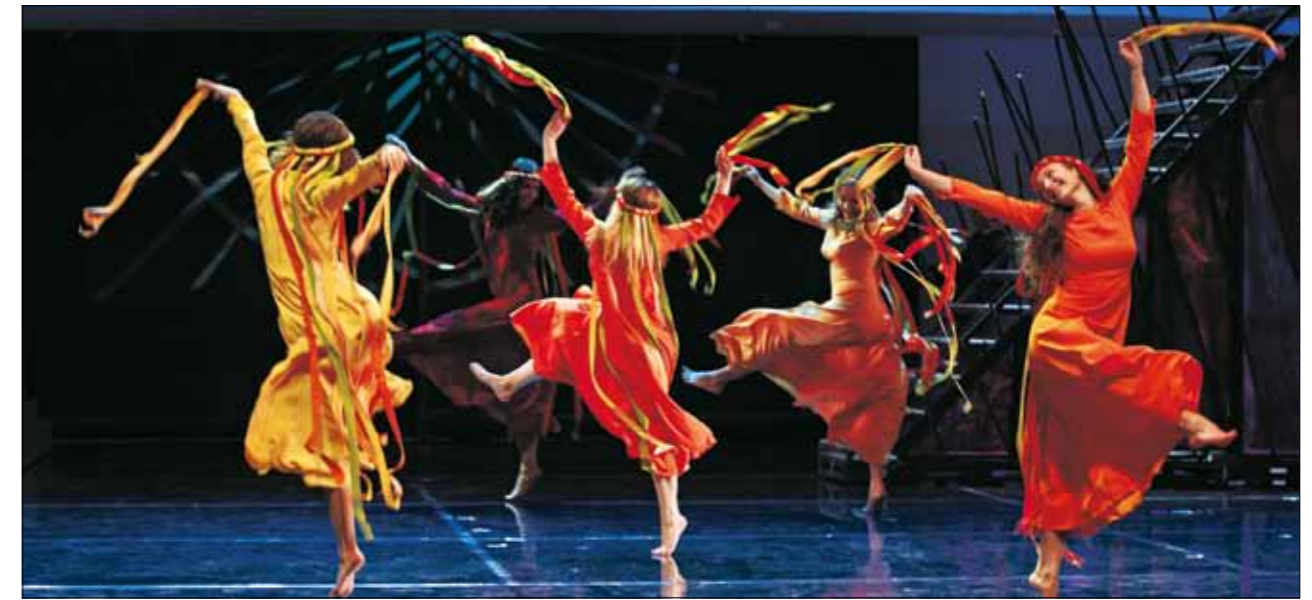
Майская песня девушек

и предвечной печали, всего того, что мы связываем с образом певца-поэта. И в то же время, как и у Блока, что-то невероятно трогательное, детски мудрое делает этот образ обаятельным и живым.