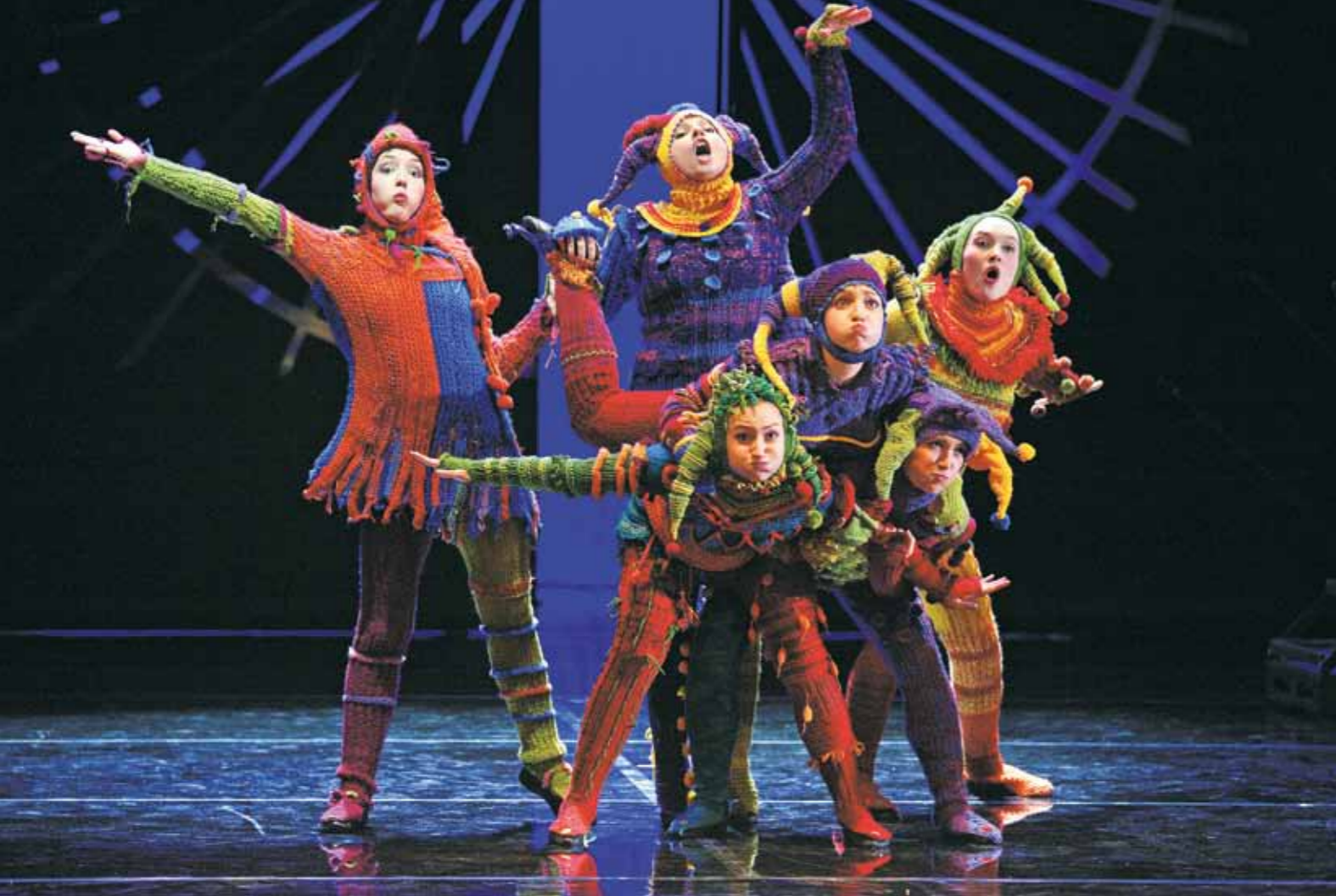
Сцена из спектакля. Жонглеры на празднике Мая