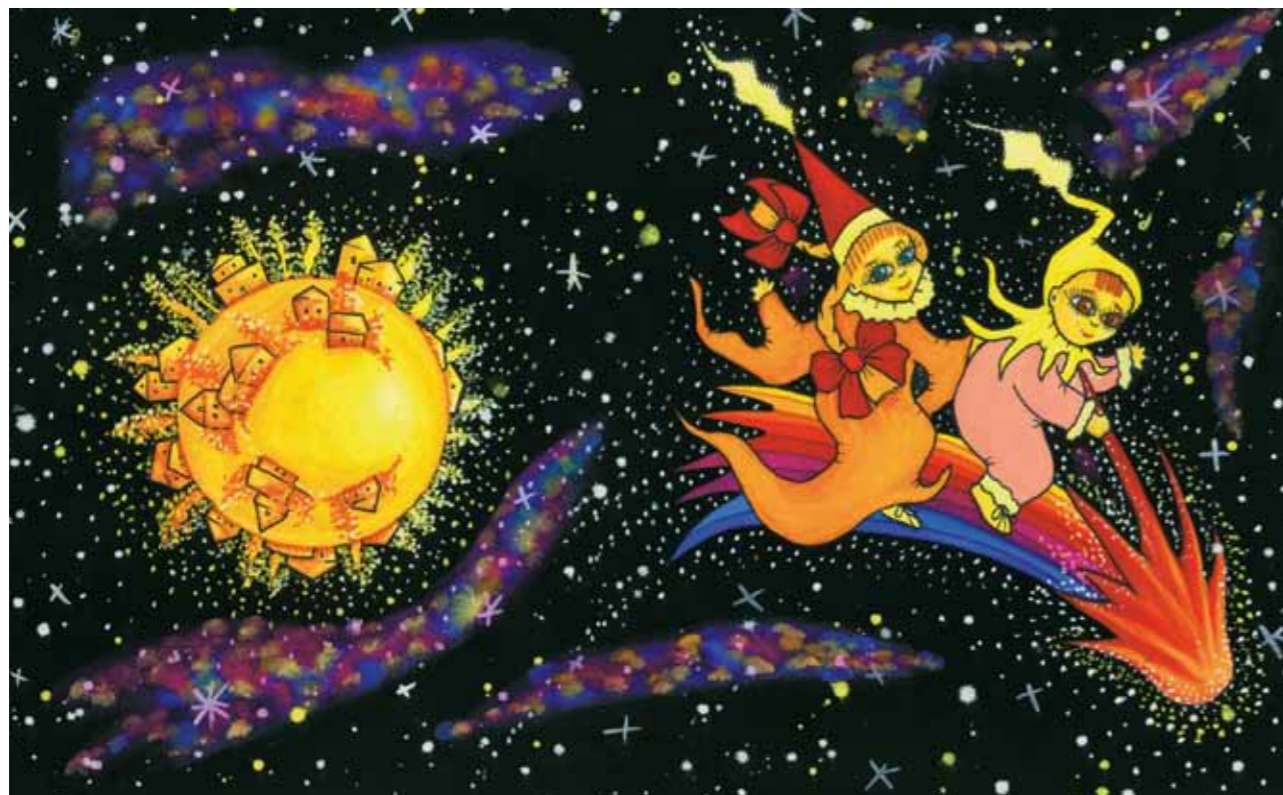
Иллюстрация к сказке автора о Лунных эльфах. 1994