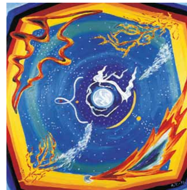
Дорога к поющим звездам