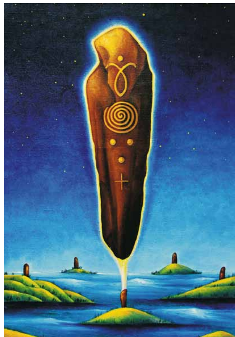
Мегалиты уходят в бесконечность. 2008