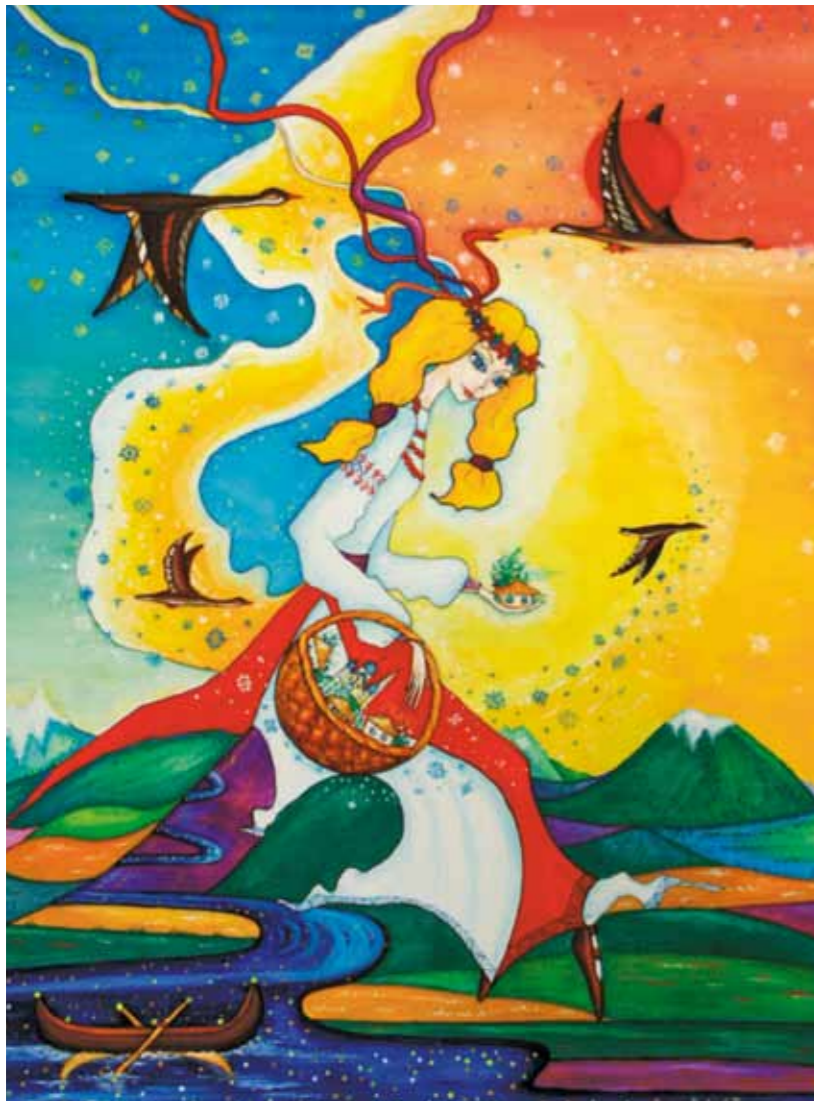
Светлая Берегиня. 1997