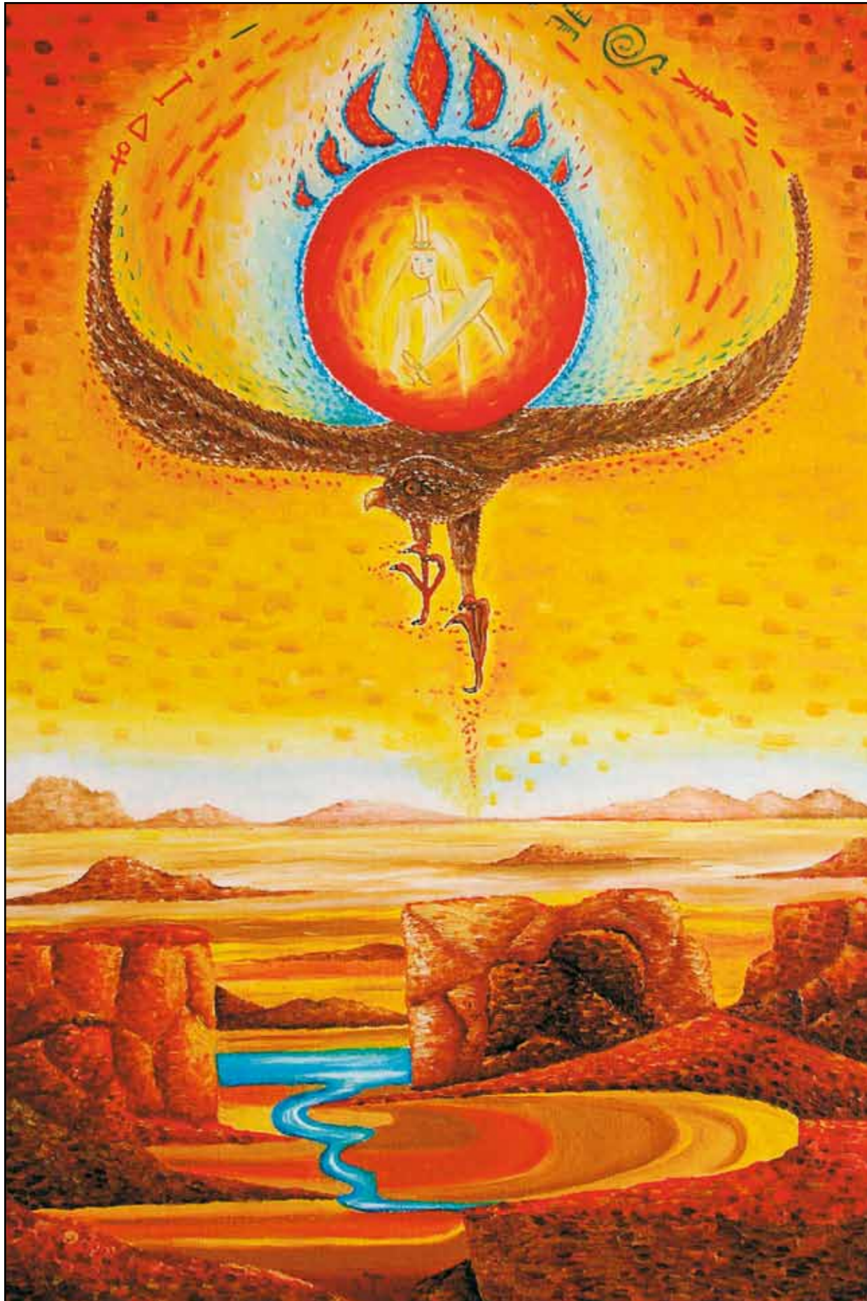
Огненный вестник. Небесное послание

чивы в хорошем смысле слова. Здесь все откроется тому, кто верит , – «по вере вашей дастся вам...». Но даже если вопрос останется без ответа, это не значит, что ответа нет. Просто время услышать его, возможно, еще не пришло.