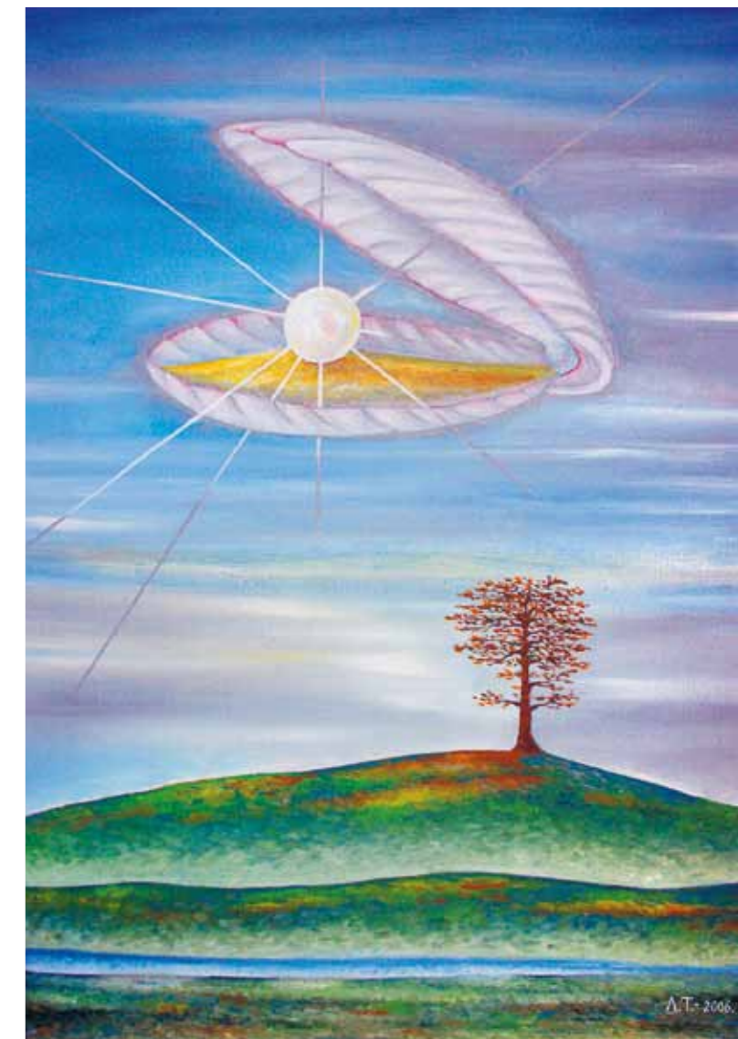
Утро. Небесная жемчужина. 2006