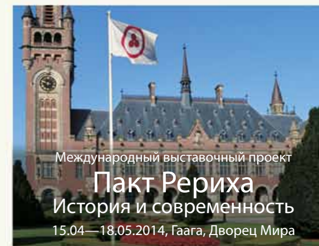
Международный выставочный проект Пакт Рериха История и современность 15.04—18.05.2014, Гаага, Дворец Мира