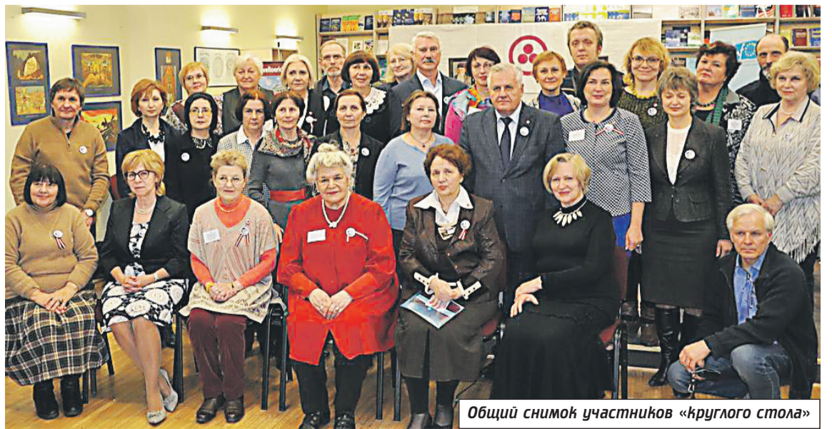
Общий снимок участников «круглого стола»

Вот поэтому, оценив то, что знаю об этой «интриге», я тоже поднял руку, когда участники «круглого стола» голосовали за то, чтобы включить в резолюцию пункт, выражающий категорический протест осознанно направленным на разрушение музея и МЦР действиям чиновников МК России. Я голосовал за то, чтобы руководство России провело независимую проверку — в каком состоянии сейчас находится наследие Рерихов, а также за то, чтобы внимание международной общественности было обращено на эту проблему по возможности больше. 7