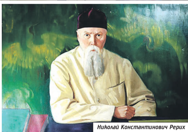
Николай Константинович Рерих

4 мая 1937 года Н. К. Рерих писал: «...Вам удалось совершить огромный шаг, приобретающий общественное значение. В конце концов совершенно неважно, по каким правительственным перипетиям будет кататься пакт. Прежде всего общественное мнение должно принять его и осознать значение охранения культурных сокровищ. Из более или менее