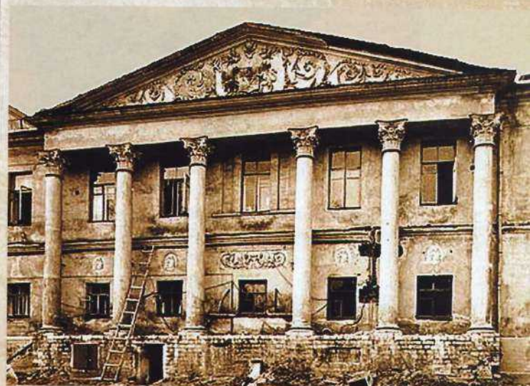
Центральная часть парадного фасада Главного дома. 1970-е гг.

Точный адрес усадьбы – Малый Знаменский переулок, названный по другой не сохранившейся Знамен-