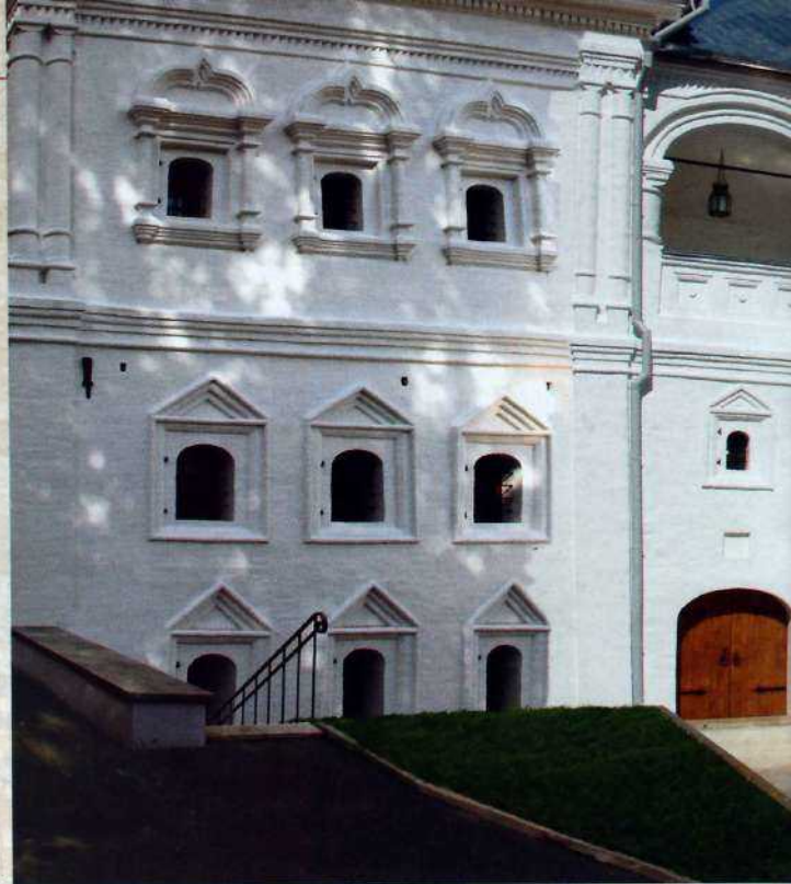
Красное крыльцо Главного дома усадьбы Лопухиных

венным Красным крыльцом, о двух этажах, на мощном подклете, с просторными сводчатыми комнатами.