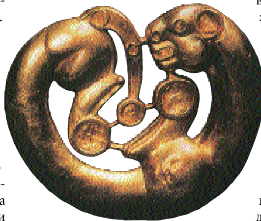
Золотая застёжка, «звериный» стиль. Сибирская коллекция

Дух, энергия огня связывает не только человеческие сердца, но и все в Космосе. Грандиозные эволюционные процессы, охватывающие различные пространства мироздания, различные состояния материи, в конечном счете имеют в своей основе огненную энергию духа. И эта энергия действует объективно, а заключенная в человеке имеет субъективный характер. Это объективное и субъективное тесно связано между собой и находится в постоянном взаимодействии. «Хотя синтез и кажется