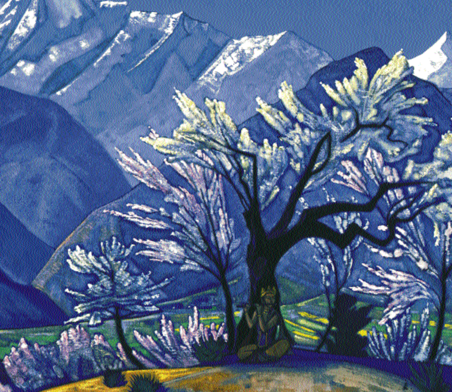
Н.К. Рерих. Кришна. Весна в Кулу

на маршруте Центрально-Азиатской экспедиции, и в последующих своих путешествиях он неумоимо собирает нужный для его концепции материал и размышляет над его сущностью. Все чаще и чаще в его работах появляются соответствующие мысли и утверждения. «...Сама жизнь формирует основания для единой мудрости», — пишет он в очерке «Сын царя» 15 .