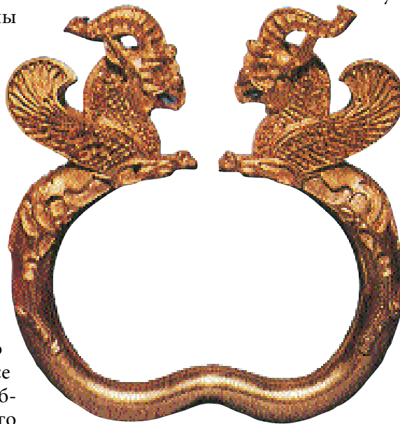
Золотой браслет, «звериный» стиль. Амударьинский клад

Исследуя российские костюмы, архитектуру, иконы, народное искусство, Рерих пишет о монгольских и готских, о византийских и скифских, о персидских и скандинавских элементах. Восток и Запад в совместном и свободном творчестве ткали удивительно красочный ковер российской культуры. «Вы чувствуете, как хитрые арабские купцы плыли по рекам русским, широко