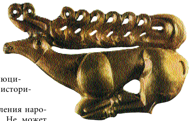
Золотая бляха, «звериный» стиль. Скифский курган

Культурный процесс, его эволюция были тесно связаны с этими силами природы, которые, собственно, и формировали тот природный поток эволюции, с энергетикой которого