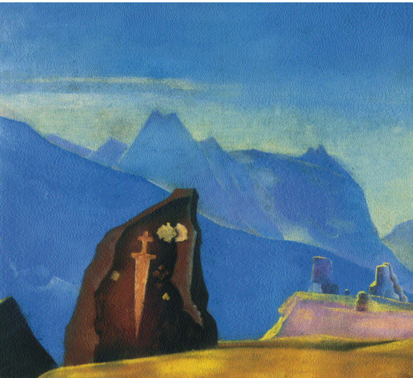
Н.К. Рерих. Меч Гесэра

отображенных в спектакле «Весна Священная».