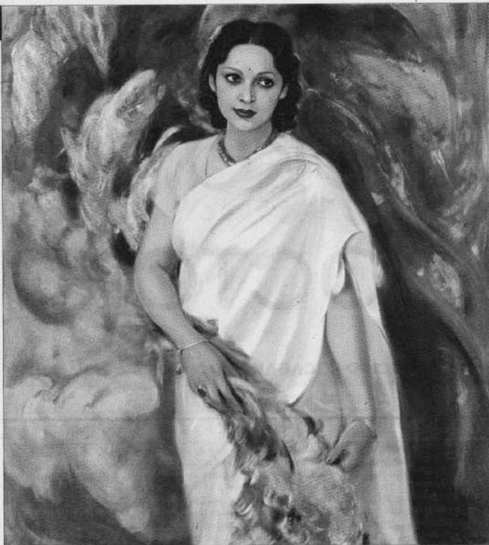
С.Н.Рерих. Мадам Девика Рани Рерих, 1946. 162,9x114,3. Счетная палата РФ установила, что в ГМВ ее размеры 52,5x57,5