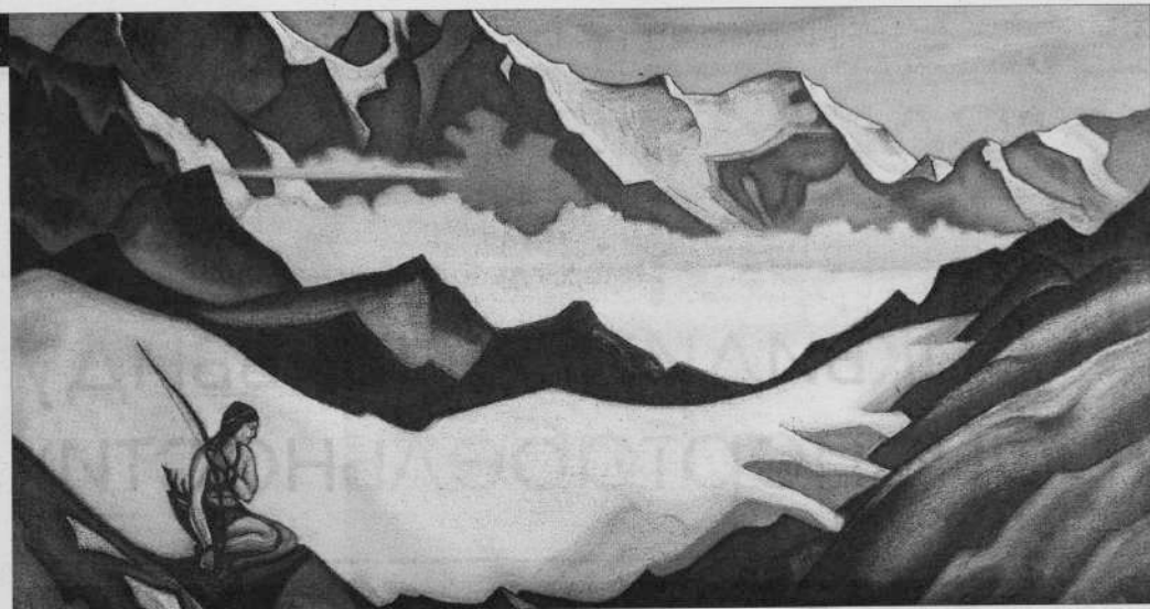
Н.К. Рерих. Дева снегов. 1947. Работа ушла из России в зарубежную коллекцию

Этот листочек, который кто-то написал себе как памятку, чтобы не забыть разницу между якобы принятыми и выданными экспонатами, не пошлит, лежит между документами строгой отчетности.