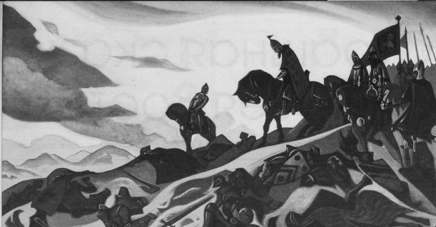
Н.К. Рерих. Александр Невский, 1942. Картина должна быть в России, однако находится за рубежом в частной коллекции

В этом же документе содержатся два принципиальных для нас момента. Во-первых, при жизни Святослава фонд получал право лишь распоряжаться наследием, но без права собственности. Права собственника С.Н. Рерих оставил за собой. И только после его смерти исключительные права на наследие должно было перейти к фонду (п. 5). Как показало время, это было мудрое решение.