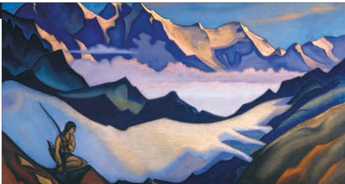
Н.К. Рерих. Дева снегов. 1947. Работа ушла из России в зарубежную коллекцию

Этот листочек, который кто-то написал себе как памятку, чтобы не забыть разницу между якобы принятыми и выданными экспонатами, не подшит, лежит между документами строгой отчетности.