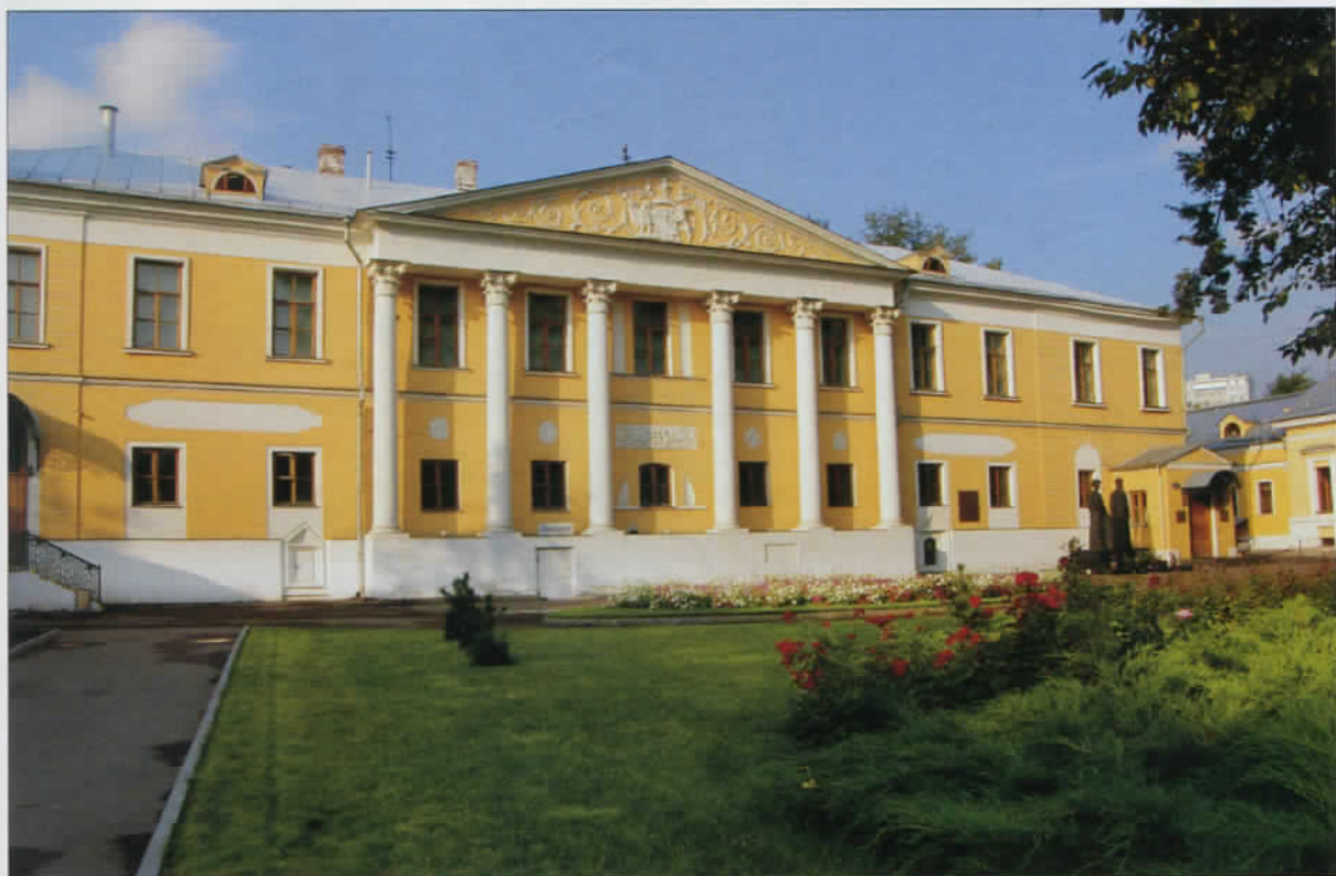
Восточный фасад главного дома

В 1802 г. усадьба уже принадлежала вдовствующей действительной тайной советнице графине Варваре Алексеевне Протасовой. В то же время к восточному фасаду главного дома был пристроен портик с колоннами, украшенный на фронте гербом Протасовых.