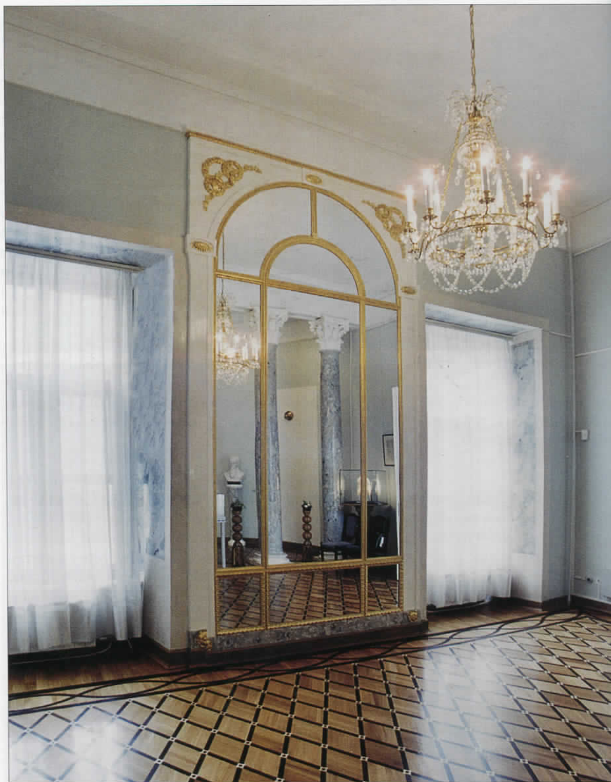
Колонный зал западной анфилады главного дома