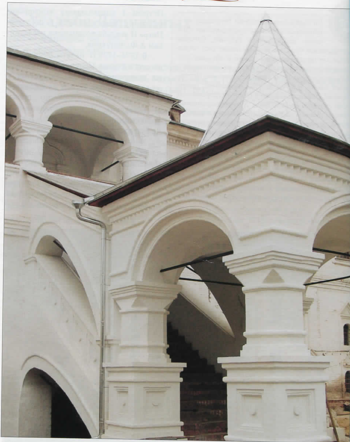
«Красное» крыльцо западного фасада главного дома