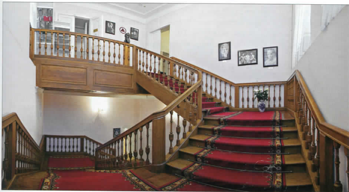
Парадная лестница главного дома

Протасовы владели усадьбой около 50 лет, а в 1850 г. она перешла к церемониймейстерше Анне Петровне Бахметьевой. Есть сведения, что усадьбу посещал знакомый с Бахметьевыми Н. В. Гоголь. С 1890 по 1891 г. усадьбой владел князь Д. А. Оболенский, а с 1891 г. — фрейлина Их Императорского Величества Государыни Императрицы Мария Михайловна Петрово-Соловово. После 1917 г. усадьба Лопухиных использовалась под жилые и административные нужды. В конце 1989 г. в здании старинной усадьбы Лопухиных был размещен Центр-Музей имени Н. К. Рериха.