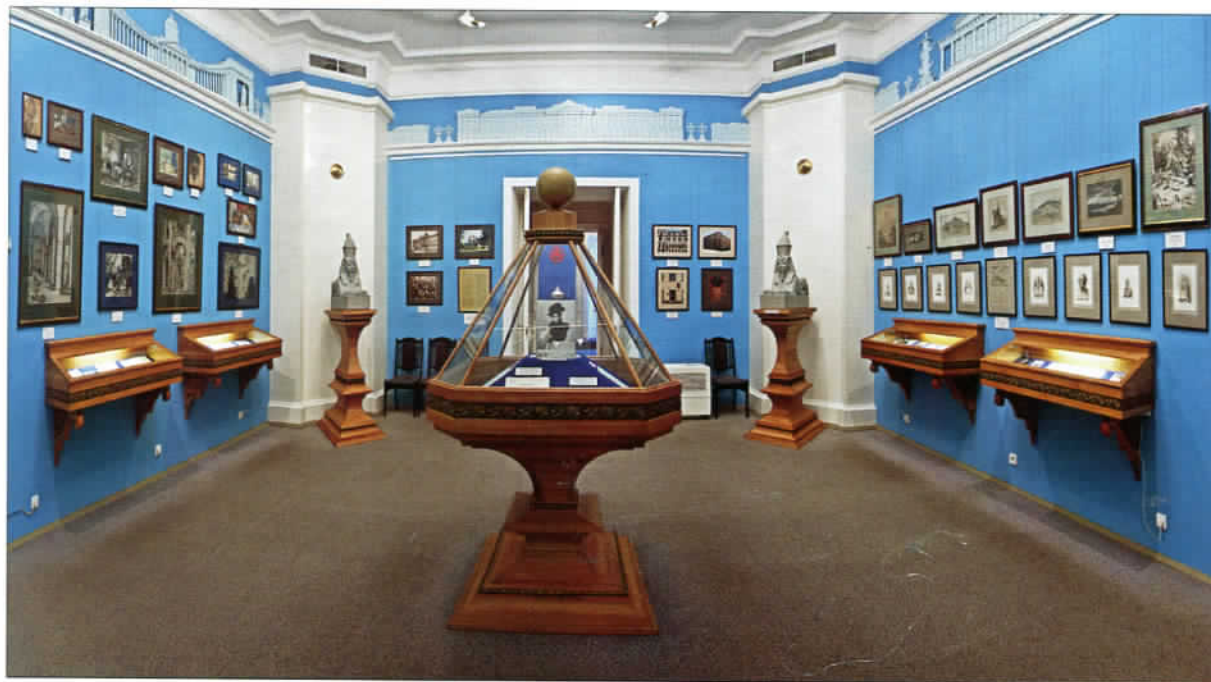
Зал западной анфилады главного дома

и белокаменных подвалов XVII в.). В подвале флигеля восстановлены стены древней палаты XVII в. Начаты работы по воссозданию утраченных в 1920-е гг. каретника и части северного флигеля.