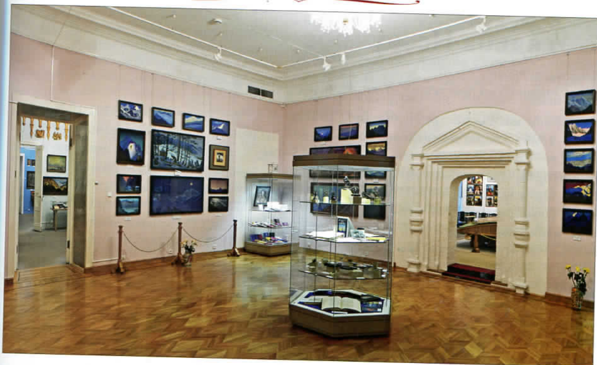
Зал западной анфилады главного дома

Бахметева (1770–1847), в 1801 г. была возведена с детьми императором Александром I в графское достоинство. Со смертью ее младшего сына, Николая Александровича, преклалась графская отрасль Протасовых, и фамилия эта, с графским титулом, перешла к Н. А. Бахметеву.