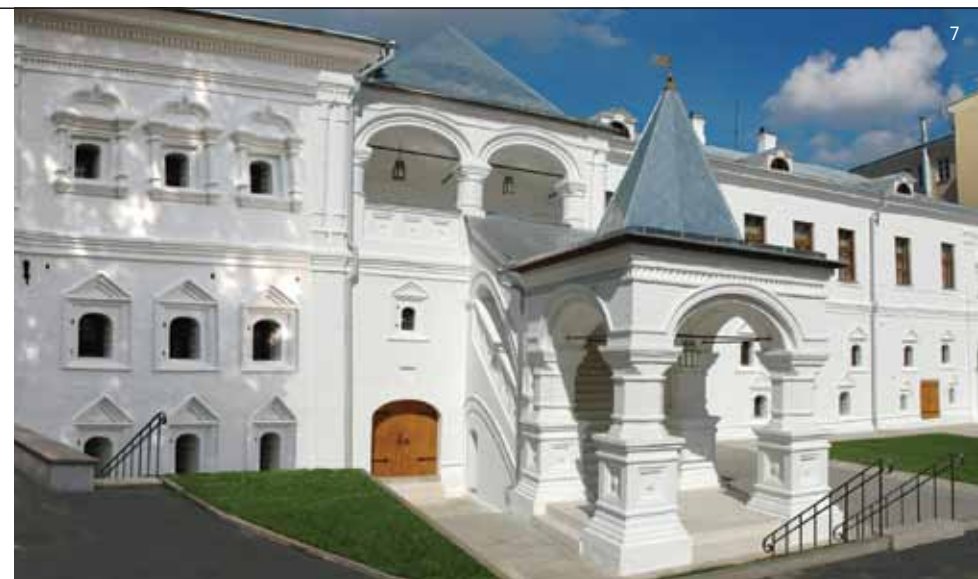
5. Часть главного фасада флигеля до реставрации. Фотография 1995-го года 6. Главный фасад флигеля после реставрации. Фотография 2004-го года 7. Панорама дворового фасада с воссозданным Красным крыльцом XVII века после реставрации. Фотография 2006-го года

До XVIII века в точном соответствии с 1-м этажом и подвалом пребывала и планировка 2-го этажа. Фасады были богато декорированы фигурными оконными наличниками, спаренными полуколонками, профилированными карнизами. Рядом с крыльцом в уровне 1-го этажа существовал сквозной проезд для карет во внутренний двор усадьбы. Он имел лотковый свод и проходил прямо по