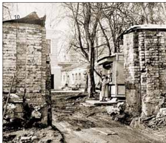
10. Пилоны парадных ворот до реставрации. Фотография 1996-го года 11. Историческая ограда со стороны Малого Знаменского переулка. Отреставрирована в 1997-м году 12. Сквозная трещина в правом крыле фасада до проведения работ по усилению фундаментов. Фотография 1994-го года