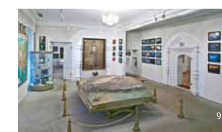
8. Зал восточной анфилады Главного дома до реставрации. Фотография 1995-го года 9. Зал восточной анфилады Главного дома после реставрации