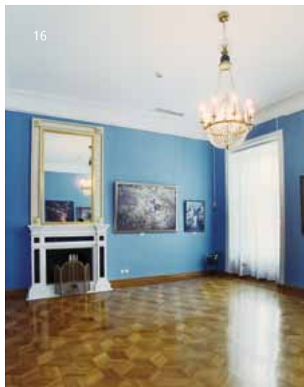
16. Каминный зал восточной анфилады. Отреставрирован в 1998-1999 годах