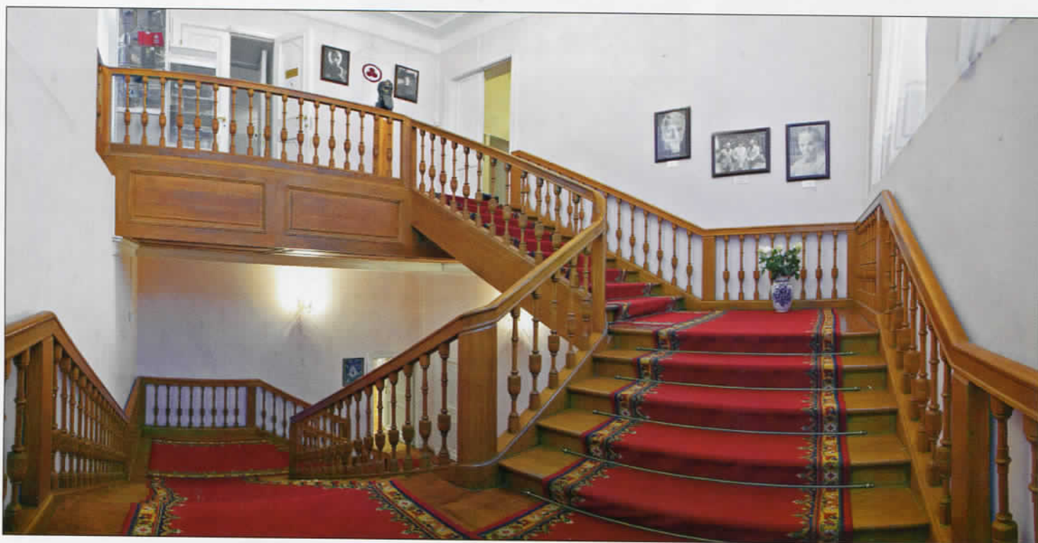
▲ Главный дом. Парадная дубовая лестница после реставрации