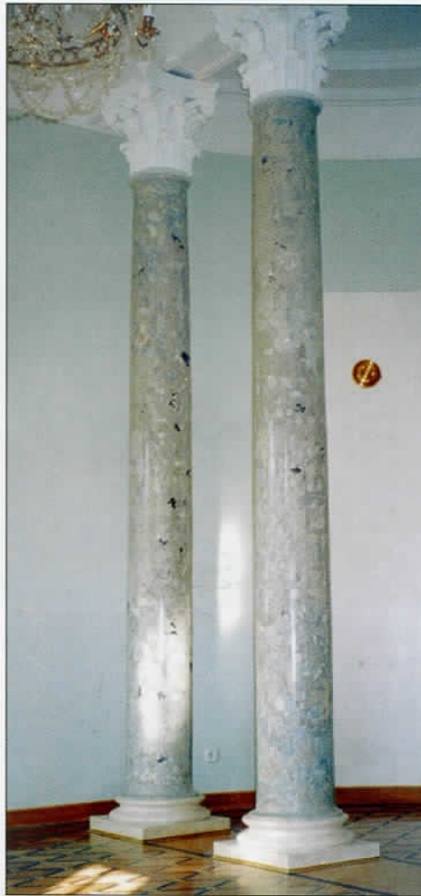
◀ Фрагмент зала восточной анфилады второго этажа главного дома с колоннами

В последней четверти XVIII века бывшие палаты Лопухиных вошли в состав Прецистенского дворца, который по заказу Екатерины II выстроил Матвей Федорович Казаков, объединив в ансамбль три мо-