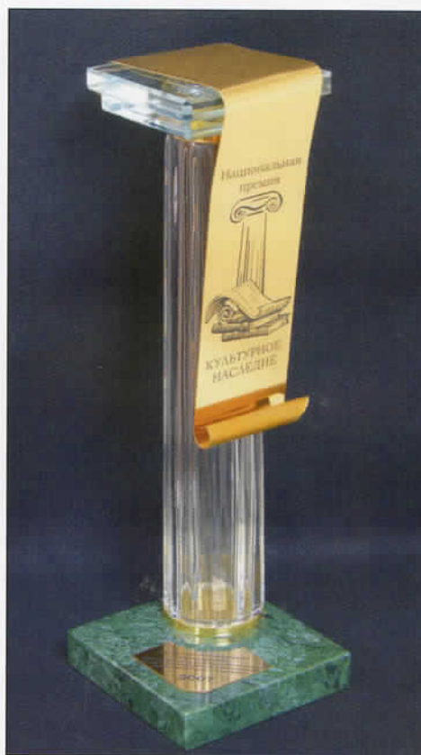
▲ Приз национальной премии «Культурное наследие»

В полукруглом зале западной анфилады были найдены следы утраченных колонн. Между лагами пола обнаружили фрагменты их капителей, а в подвале — элементы отделки из искусственного итальянского