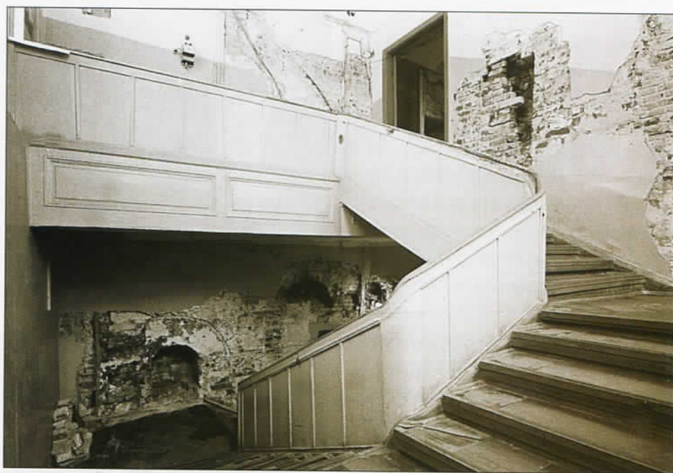
▲ Главный дом. Парадная лестница до реставрации

Так продолжалось до начала 1990-х годов, пока усадьбу не передали Международному Центру Рерихов. В особняке Лопухиных открыли общественный Музей имени Н.К. Рериха, и начался долгий период реставрации, которую возглавила Л.В. Шапошникова. То, в каком виде здание досталось Рериховскому центру, зафиксировано на многочисленных фотографиях. Из-за проседания фундаментов главный усадебный дом и флигель были испещрены многочисленными трещинами. Самая большая из них проходила между центральной частью и северным ризалитом основного особняка. Кроме того, для нужд размещавшегося здесь треста Министерства тяжелого машиностроения в здании несколько раз проводили перепланировку, лишенную исторического обоснования. При въезде на территорию усадьбы на месте старинной кованой ограды первой половины XVIII века сохранились лишь обломки парадных пилонов, а прямо перед фасадом главного дома строилась трансформаторная подстанция. Несмотря на то что для создания Музея Н.К. Рериха правительство Москвы обязало Минтяжмаш привести главный дом усадьбы в порядок, прежде чем освободить его, машиностроители этим пренебрегли. В городском бюджете