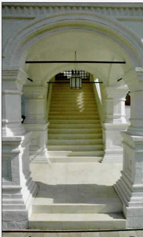
▲ Вход на первый ярус воссозданного Красного крыльца