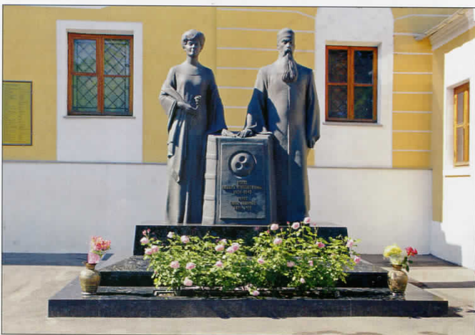
▲ Памятник Николаю и Елене Рерихам

Кроме того, в 2010 году Департамент культурного наследия Москвы представил реставрацию усадьбы Лопухиных среди лучших восстановительных работ столицы на Лейпцигской международной выставке, посвященной достижениям в области сохранения памятников культуры и архитектуры.