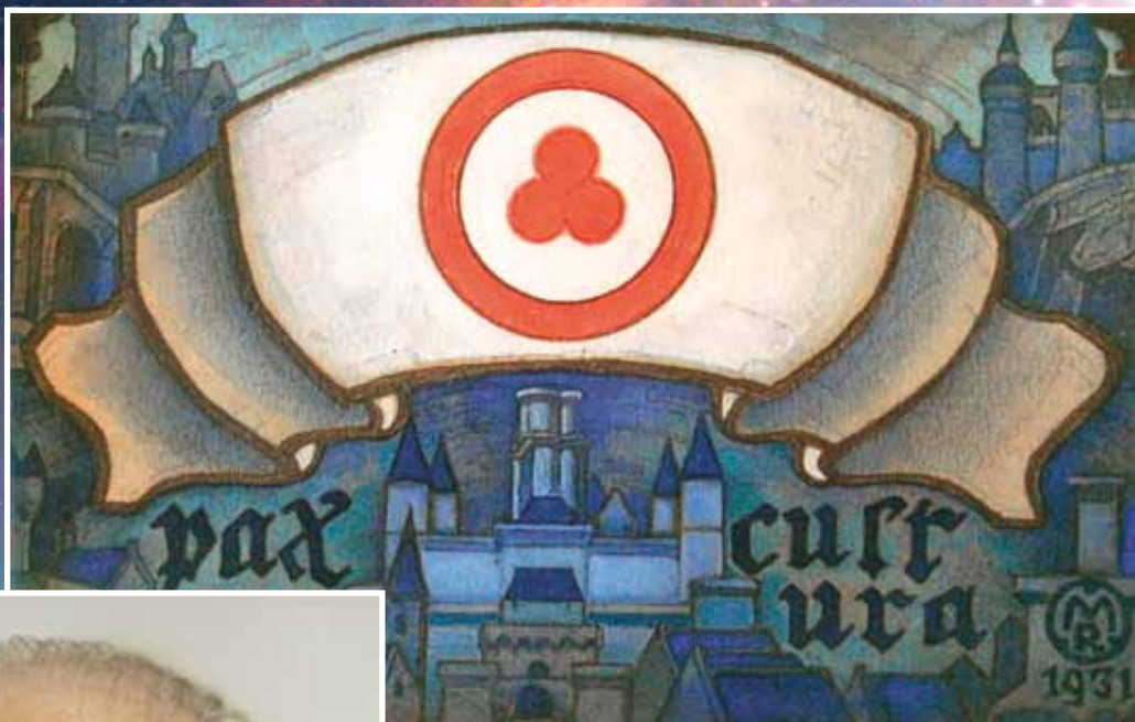
Н.К. Рерих. Pax Cultura (Знамя Мира). 1931