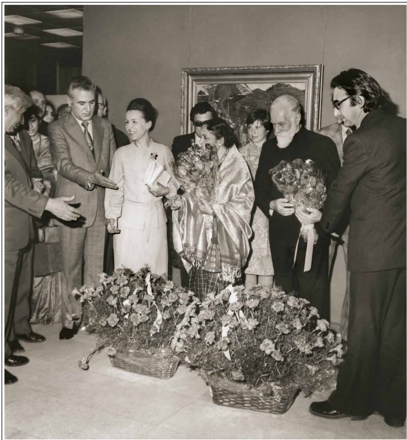
125. Л.Т.Живкова, Девика Рани Рерих и С.Н.Рерих на выставке произведений Н.К.Рериха в Софии (Болгария). 1978