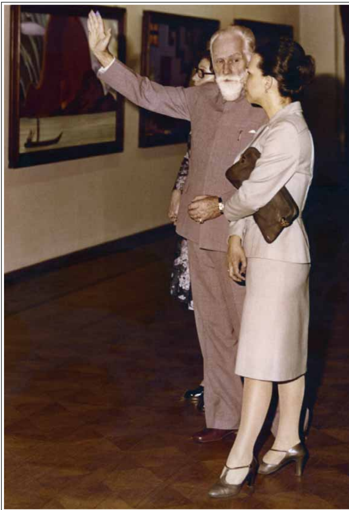
123. С.Н.Рерих и Л.Т.Живкова на выставке произведений С.Н.Рериха в Софии (Болгария). 1978