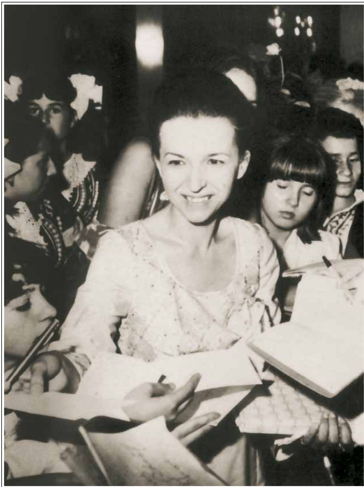
119. Людмила Тодоровна Живкова. 1970-е