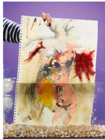
Акварель, погруженная в ЗМ™ Noves™ 1230

В 2005 году Группа Компаний «Пожтехника» впервые вывела на российский рынок пожарной безопасности газовое огнетушащее вещество ФК-5-1-12 (Новек) и установки автоматического газового пожаротушения с его применением.