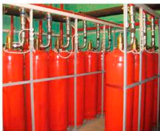
Установка пожаротушения с применением ФК-5-1-12 (Новек) в Государственном Центральном Музее Музыкальной Культуры им. Глинки М.И.