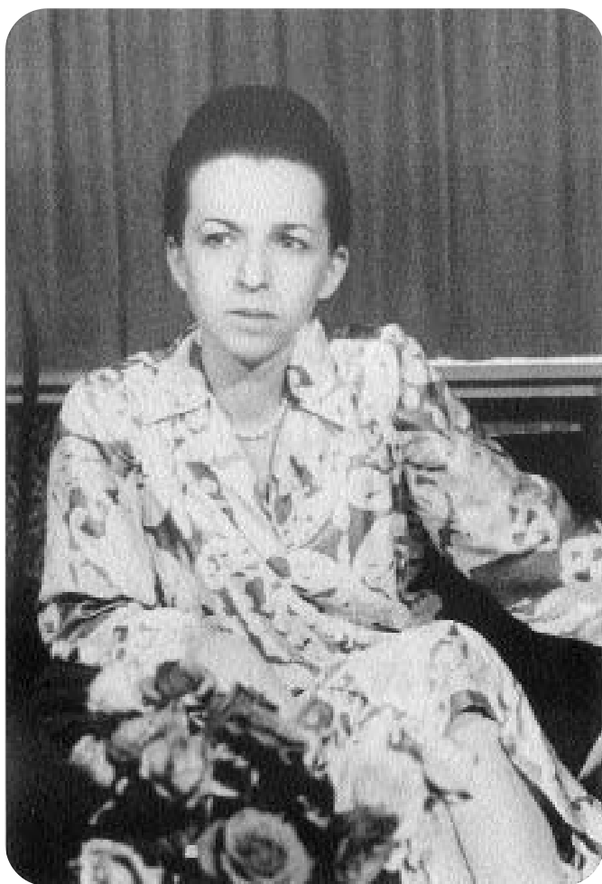
Людмила Живкова. 1979 г.

имя был наложен негласный запрет, и, казалось, кто-то невидимый и могучий держал этот запрет под строгим контролем. Среди моих собеседников были творческие работники, деятели культуры, ученые, но все они как будто сговорились между собой и свято блюли принцип — «молчание — золото». Они отталкивали от себя ее идеи, избегали оценок и с облегчением переходили на обсуждение других вопросов, не имевших к Живковой никакого отношения. Во всем этом были какие-то темные, недосказанные отголоски борьбы против человека, который стремился изменить государственные принципы Болгарии, сделать их более светлыми, красивыми и человечными. Видимо, Живковой этого до сих пор не простили. И не только те государственные чиновники, которые выступали, открыто или скрыто, против нее, но и те, кто, называя себя деятелями культуры, не постигли сущности этой культуры и так и не поняли, чего хотела от них их великая, до сих пор не признанная ими подвижница, несколько лет руководившая культурой Болгарии на государственном уровне.