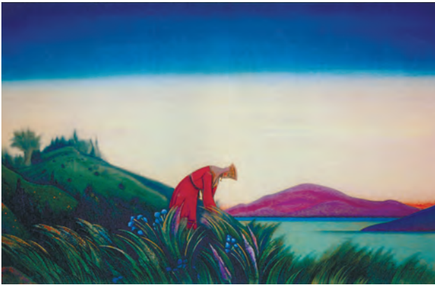
Рерих Н.К. Добрые травы (Василиса Премудрая). 1941

связь между физическим состоянием природы и духовным состоянием человека, между характером природы и историей проживающего в определенной местности народа, особенностью его национального характера, отношения к жизни. Представленная Н.К. Рерихом совокупность отношений человека и природы – «Там, где природа крепка, где природа нетронута, там и народ тверд без смятения» (очерк «Чаша неотпитая») – позволяет рассматривать и анализировать механизмы формирования мировоззренческих установок человека в отношении природного наследия. Это обращение мышления к природе, обращение мышления к труду как сотрудничеству с природой, почитание природы как источника жизни и познания (очерк «К природе») и пр. Отчужденность, отстраненность, равнодушие к природе в результате ее глубокого изучения и бережного отношения должны смениться доверием, вниманием, интересом к ней, что укрепит в человеке нравственные основы.