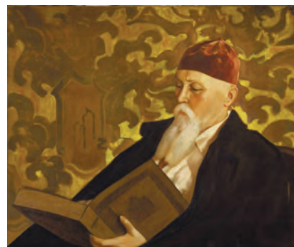
Рерих С.Н. Профессор Н.К. Рерих. 1934

И з писем Н.А. Рубакина, выдающегося книговеда, библиографа, популяризатора науки, видно, насколько высоко он оценивал идею всемирно известного художника и общественного деятеля Николая Константиновича Рериха об охране культурных ценностей и как горячо выражал готовность присоединиться к ней. Н.А. Рубакин в 1930-е годы писал: «Особенно поразило и восхитило то, что [Н.К. Рериху] удалось сделать для защиты в военное время художественных, научных, исторических и культурных памятников. Восхищает Пакт Рериха, его ратификация, Пакт Знамени Мира... Под всем этим мы энергично подписываемся.