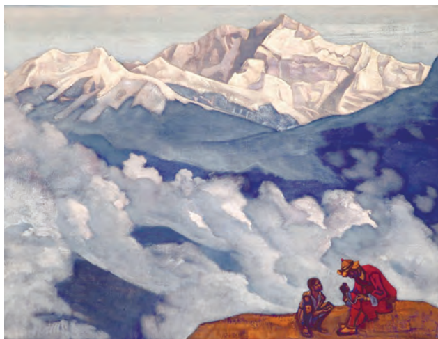
Рерих Н.К. Жемчуг исканий. 1924

Разрабатывая концепцию школьного образования, Н.К. Рерих был убежден, что образование должно утвердить, прежде всего, сознание учащихся,