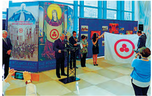
Выставка «Пакт Рериха. История и современность» в штаб-квартире ООН в Нью-Йорке. 2015 г.

Основная задача Пакта Рериха состояла в том, чтобы утвердить «Мир через Культуру», т. е. утвердить в сознании человека понимание того, что мир и культура – фундаментальные основы эволюции человека (очерк «Врата в будущее», 1936). С точки зрения Н.К. Рериха, это может стать той общей целью, которая способна консолидировать людей в социальной жизни,