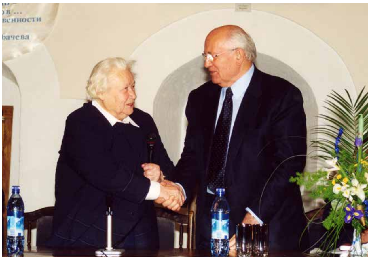
А.В. Шапошникова и М.С. Горбачев на вечере памяти Раисы Максимовны Горбачевой в Международном Центре Рерихов. 2001

для утверждения идей Рерихов, – сказал он тогда, – и мне вспоминаются в связи с этим слова великого русского писателя Льва Николаевича Толстого: “Я не приемлю прогресс, который отвергает Восток”. Разумеется, Восток здесь понимается как уникальное духовное и культурное богатство. Между культурами не может быть соперничества, они призваны вести диалог, взаимообогащая друг друга 4 . Участники этой памятной встречи говорили, что невидимый центр происходящего в «постгорбачевской» России все более перемещается из пространства, где человека испытывают на хорошее , в сферы, где он становится объектом провокационных проверок на плохое . Кто-то вспомнил слова актера и режиссера Олега Ефремова: «Мы в те годы боролись за свободу культуры, теперь должны бороться за культуру свободы».