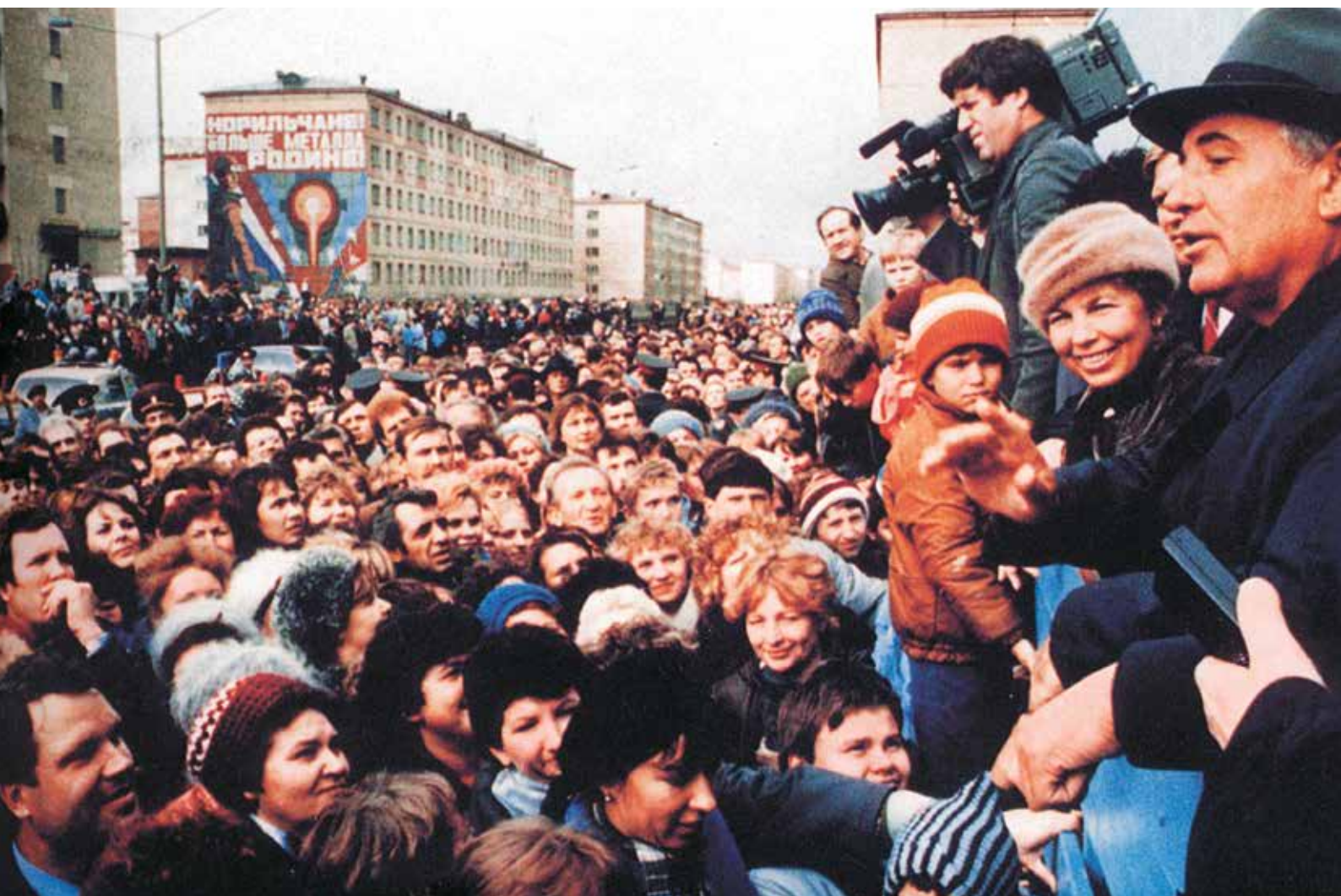
С жителями Заполярья, Норильск, 1988

Горбачев – один из инициаторов ежегодного Форума лауреатов Нобелевской премии мира. Тема встречи 2010 года – «Наследие Хиросимы – мир без ядерного оружия». В обращении к участникам Форума Михаил Сергеевич говорит о том, что «принцип мирного урегулирования споров