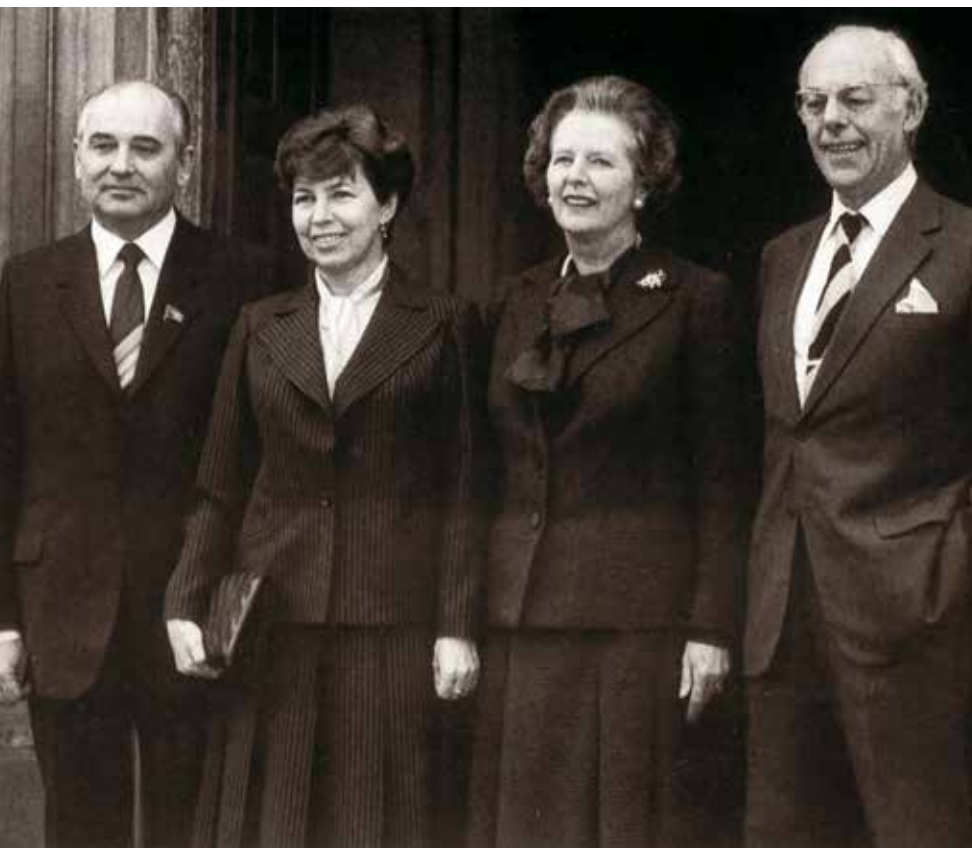
Англия, Чекерс, 1984