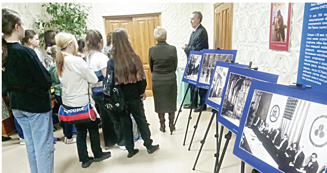
■ Выставка в ДШИ №14 открыта для свободного посещения, организаторы просят иметь при себе паспорт. Дети допускаются в сопровождении взрослых (6+).

Символично, что именно в этот день, 15 апреля, в 1935 году главами 20 государств был подписан первый в истории международный договор «Об охране художественных и научных учреждений и исторических памятников», который стал известен как Пакт Рериха. В рамках договора был утвержден пред-